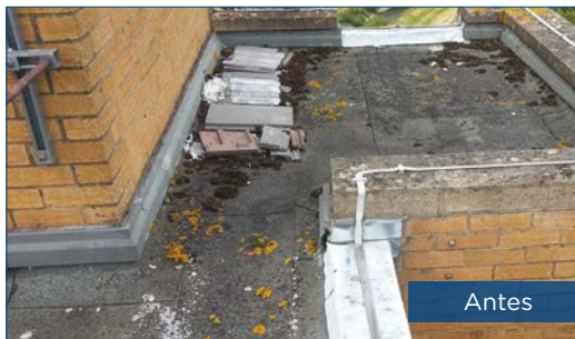
Proteção duradoura para o telhado