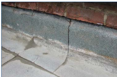
Juntas de vedação vazando