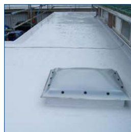
Resistente à água

Os materiais Belzona têm pouco odor e baixo índice de VOC, assegurando o mínimo transtorno às operações. Isto pode ser visto em um recente projeto de revestimento de telhado realizado em um ambiente escolar movimentado, onde o vazamento do telhado foi perfeitamente reparado sem interferir com os estudantes e seus estudos. ■