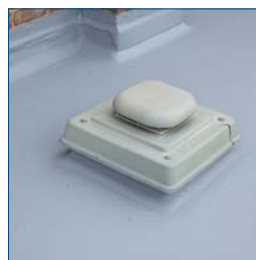
Permanece flexível em serviço