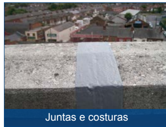
Juntas e costuras