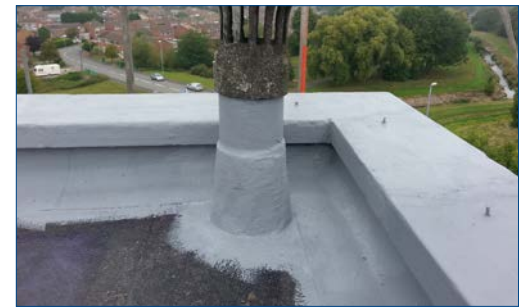
Aplicação em contornos complexos