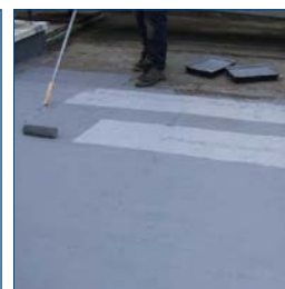
Facilmente aplicável com pincel ou rolo