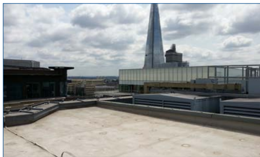
Telhado limpo e preparado

O cliente declarou-se muito satisfeito com a aplicação. O coordenador do projeto disse: "os contratados que realizaram o serviço fizeram um ótimo trabalho, com muito profissionalismo. Não tivemos interrupções em nossos negócios nem quaisquer reclamações durante todo o serviço." Ele acrescentou: "com toda certeza, recomendarei Belzona em qualquer futuro projeto onde seus sistemas possam ser usados." ■