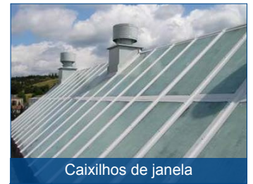
Caixilhos de janela