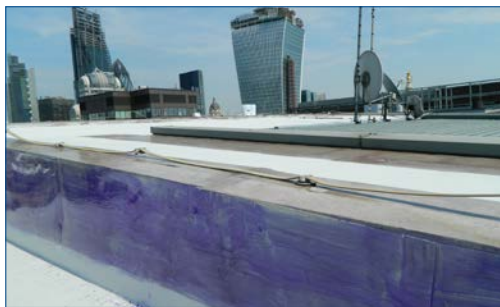
Superfície condicionada para garantir boa aderência