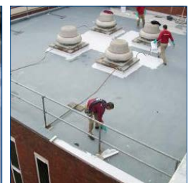
Aplicação de 3111 em andamento