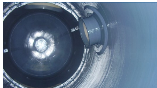
Технологическая емкость защищена от коррозии

Сварка внутренних элементов емкостей требует послесварочной термообработки. Кроме того, в некоторых случаях горячая обработка недопустима. Техника холодного крепления применяется во многих отраслях, а в последние годы лабораторные и эксплуатационные испытания подтвердили, что решение холодного крепления Belzona для технологических емкостей является предпочтительным, чтобы модификация могла соответствовать изменениям характеристик потока. ■