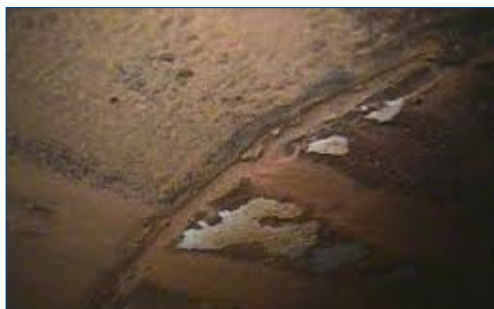
Сепаратор, подверженный коррозии

При применении полимерной матрицы с высокой плотностью поперечных связей и армирующими наполнителями, обеспечивающими барьерную защиту, тенденцию к проникновению воды и