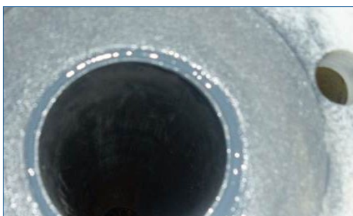
Защита фланцев и патрубков малого диаметра