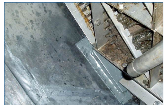
Проверка через восемь лет