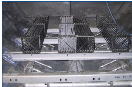
Балки холодного соединения

Через 8 и 10 лет после выполнения работ выполняли проверку сепаратора. Закрепленные с помощью материалов Belzona фитинги находились в превосходном состоянии. ■