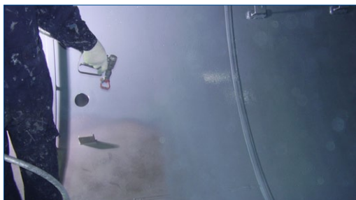
Наносимая распылением облицовка Belzona

Подготовка поверхности проводится в соответствии с установленными принципами: обычно после испытания на внутренние загрязнения поверхность