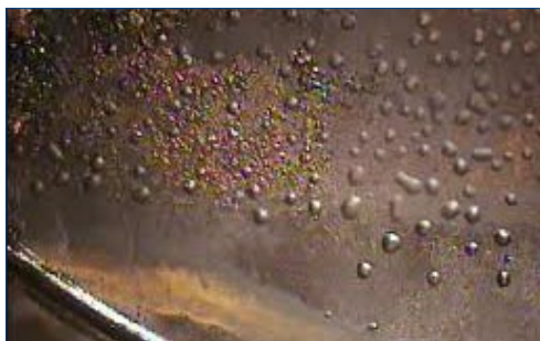
Образование пузырей в покрытии с низкой плотностью поперечных связей