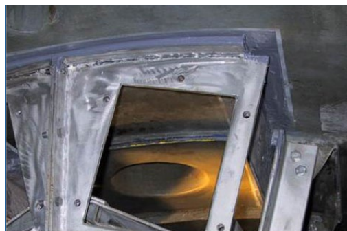
Крепление верхних фитингов