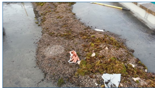
Удаление мусора и растительности

Благодаря разнообразию вариантов кровельной системы Belzona, бригада ремонтников смогла применить на каждом участке ремонта наиболее подходящие для этой ситуации материалы. Прочная гибкая и эластичная полимерная пленка плотно облегает все контуры крыши, герметизируя и обеспечивая долговременную защиту для каждого участка кровли. ■