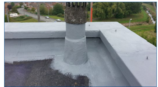
Нанесение покрытия на подложку сложной конфигурации