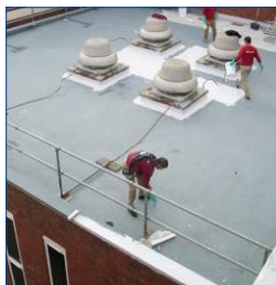
Процесс нанесения Belzona 3111

Этот универсальный материал обладает превосходной стойкостью к атмосферным воздействиям и отличной водонепроницаемостью, обеспечивая при этом надежную защиту от ультрафиолетового излучения.