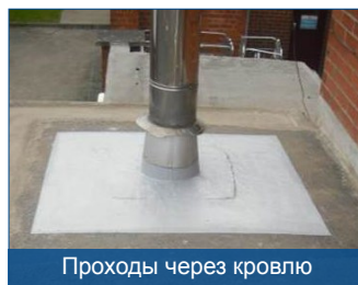
Проходы через кровлю