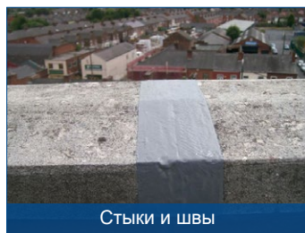
Стыки и швы