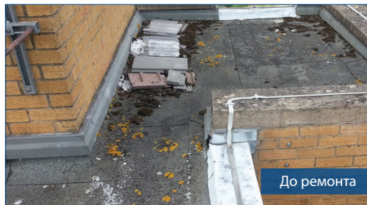
До ремонта После ремонта