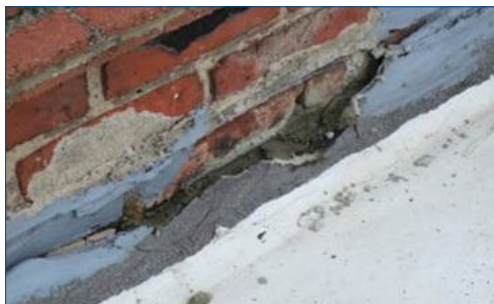
Разрушенная изоляция в месте примыкания

Есть много причин, по которым эти методы не обеспечивают комплексных ремонтных решений, который были бы экономически эффективными, неразрушающими, долговечными и в высшей степени надежными. ►►