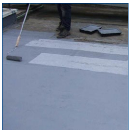
Легкое нанесение кистью или валиком