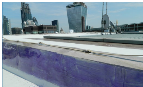
Поверхность обработана кондиционером для усиления адгезии