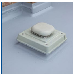
Сохранение гибкости при эксплуатации