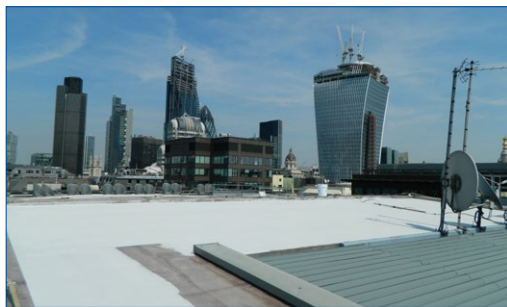
Нанесен первый слой Belzona 3111