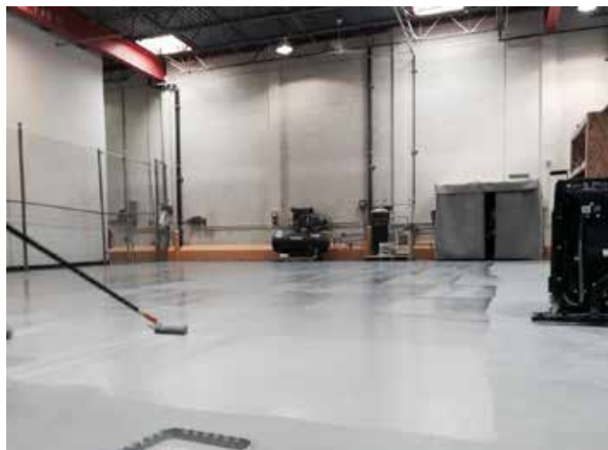
Belzona 5233 puede aplicarse fácilmente a mano con brocha o rodillo

Este sistema sin solventes es fácil de mezclar y aplicar con rodillo o brocha, sin necesidad de trabajo en caliente.