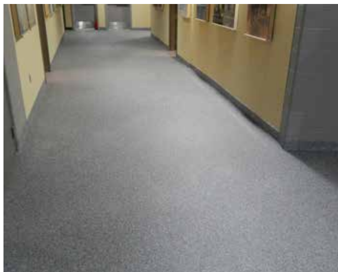
Usado como capa superior sobre Belzona 5231 con hojuelas de vinilo de origen local.

Si necesita más información, comuníquese con el representante de Belzona de su localidad: