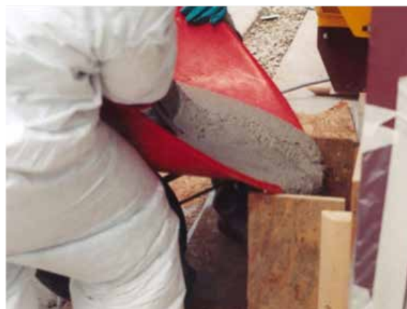
Vertido del sistema Belzona 7211

Si necesita más información, comuníquese con el representante de Belzona de su localidad: